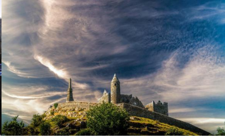
Rock of Cashel