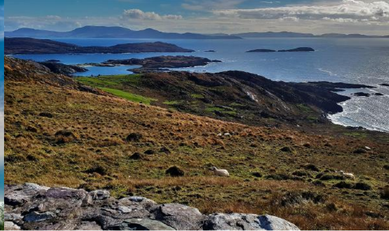
Ring of Kerry